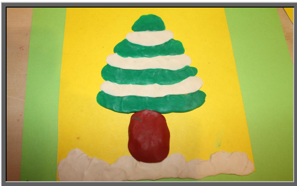
Рис.4 Начинайте крепить колбаски на картину и прижимать пальцами, разминая мягкую массу, формируя крону и придавливая ее к бумаге. Продолжайте формирование елочки, добавляя белые и зеленые колбаски, каждую придавливайте пальцами по отдельности. В процессе работы колбаски можно крепить к бумаге, слегка изогнув концы вверх.

их по цветам, чтобы получить конусообразное зеленое деревце, каждая ветка которого притрушена снежком.