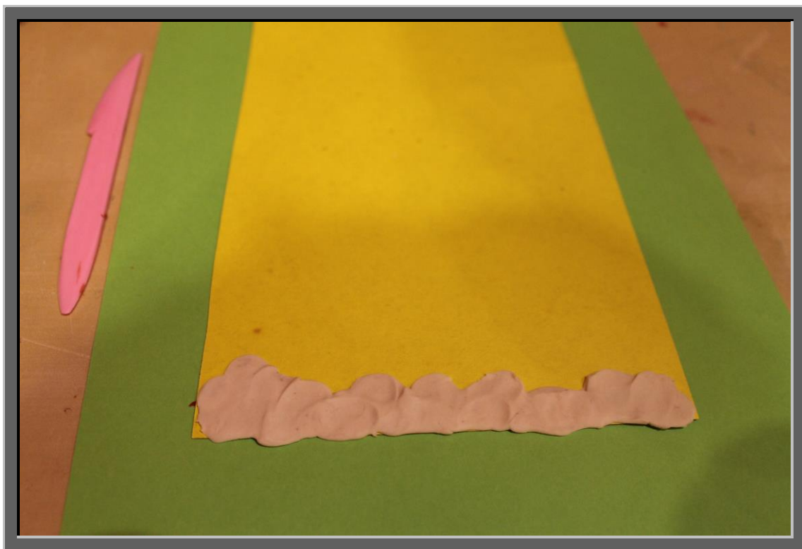
Рис. 1 Сделайте нижнюю часть рисунка, добавив белую колбаску по самому краю. Таким образом, вы покажете слой снега. Придавите пластилин пальцами.

Елочка должна быть зеленой, именно этот цвет пластилина мы сделаем центральным. Также крону можно дополнить белым цветом, чтобы показать маленькую елочку, которая родилась в лесу. А еще деревце обязательно нужно нарядить яркими игрушками и мишурой. Итак, приступим к новогоднему творчеству.