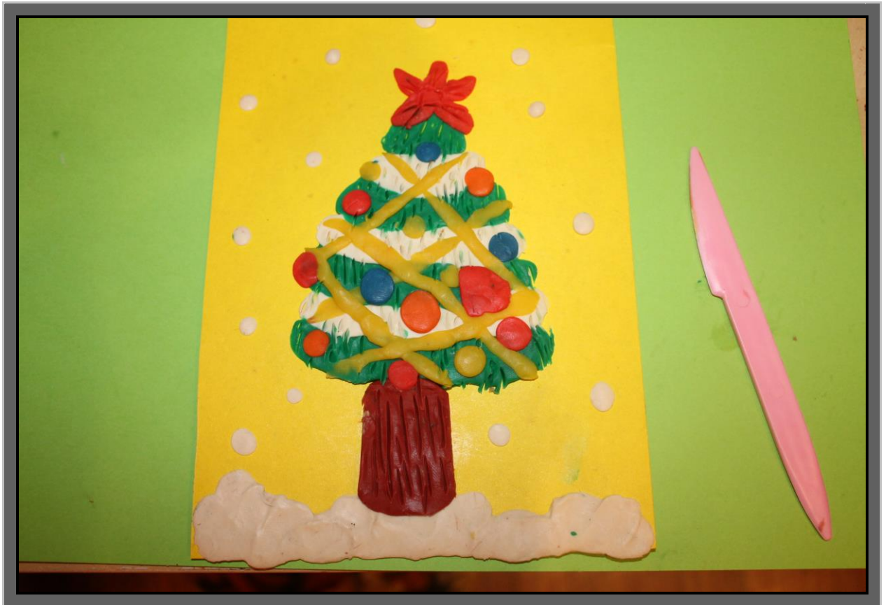
Рис. 6 Прорисуйте, с помощью стеки, мелкими насечками всю елочку. На зеленой кроне, таким образом, вы покажете иголочки, белый снег – сделаете пушистым.

На фон вы можете добавить белые точки в виде снега, который тихо падает в лесу и постепенно укутывает нарядную елочку.