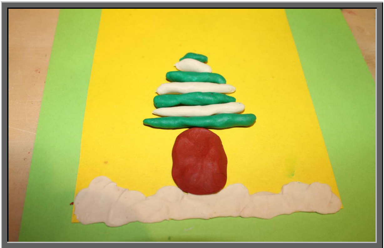
Рис. 3 Из зеленого и белого пластилина скатайте колбаски. По длине параметр колбасок следует постепенно уменьшать и обязательно чередовать