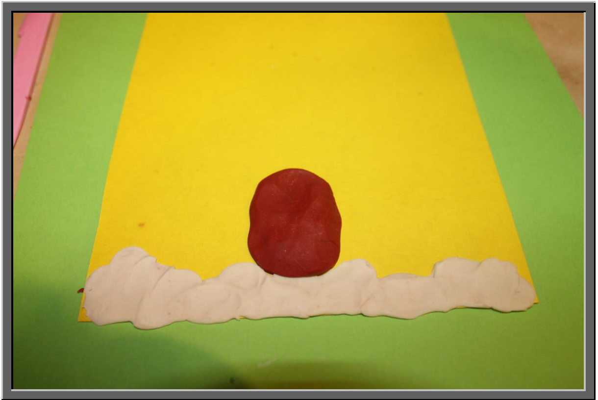
Рис. 2 Сверху над сугробом по центру приклейте коричневый пенек. Придавите пластилин пальцами или всей ладонью.