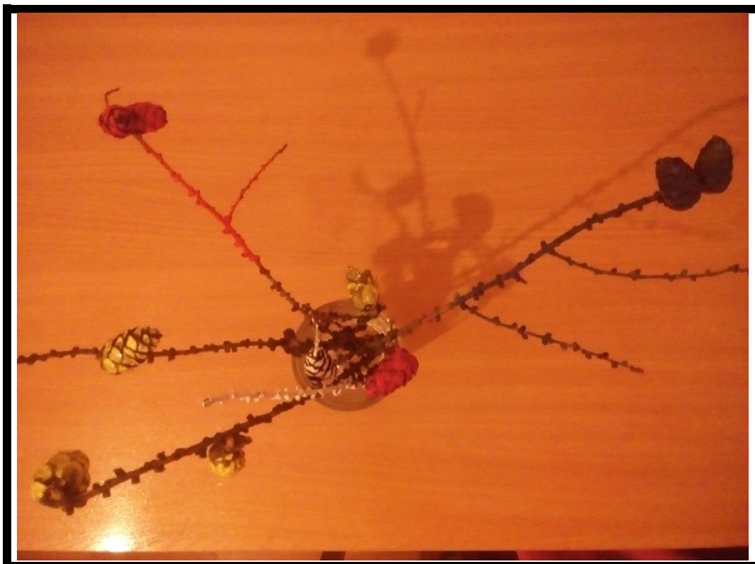
5. Рис.№ 5 Дадим шишкам подсохнуть