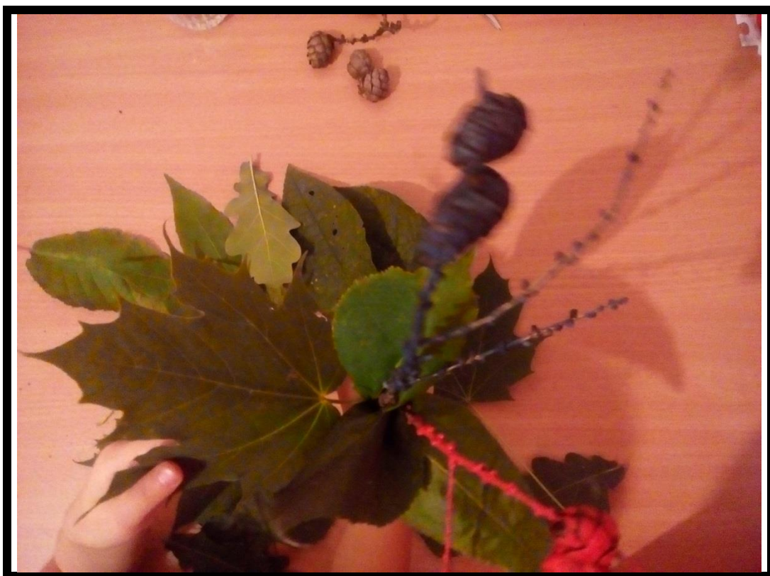
6. Рис. № 6 Собираем букет и закрепляем снизу декоративной лентой.