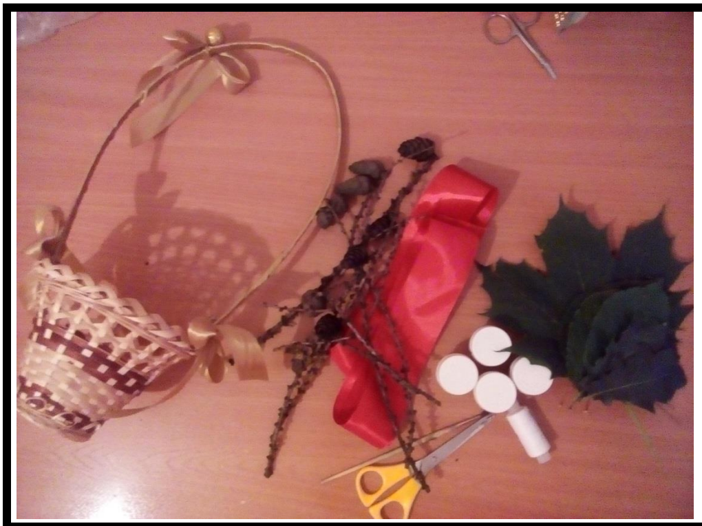
1.Рис. № 1