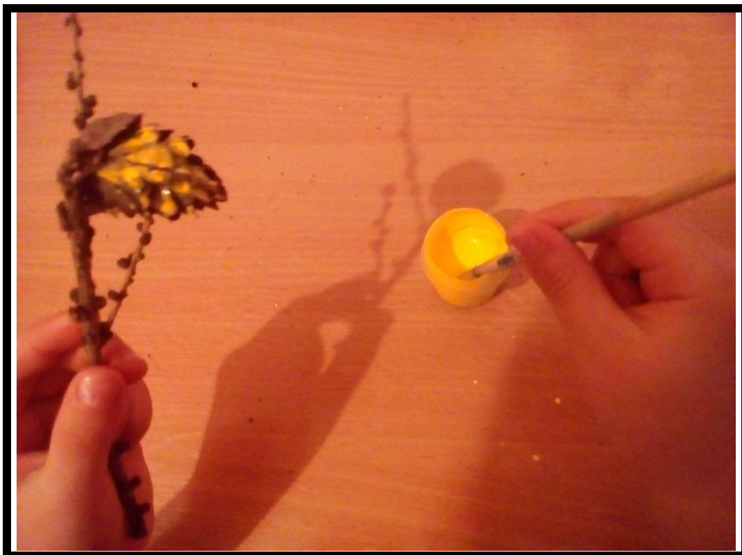
4. Рис. № 3 Раскрашиваем шишки гуашью, цвета предложите детям подобрать самим.