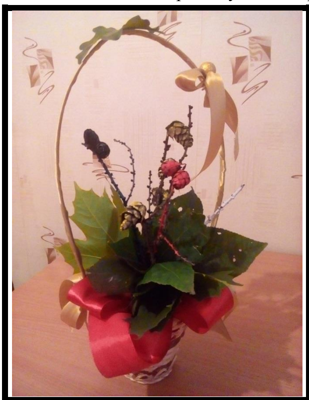
7. Рис. № 7 Устанавливаем букет в вазу или в корзинку. Наш интерьерный букет из осенних листьев готов!