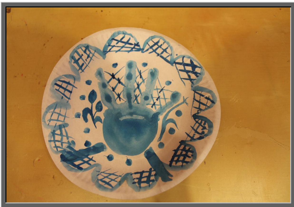
Рис.6 Украсить гжельский цветок лепестками и стебельками, нанося легкие вертикальные и горизонтальные изогнутые линии и овалы.