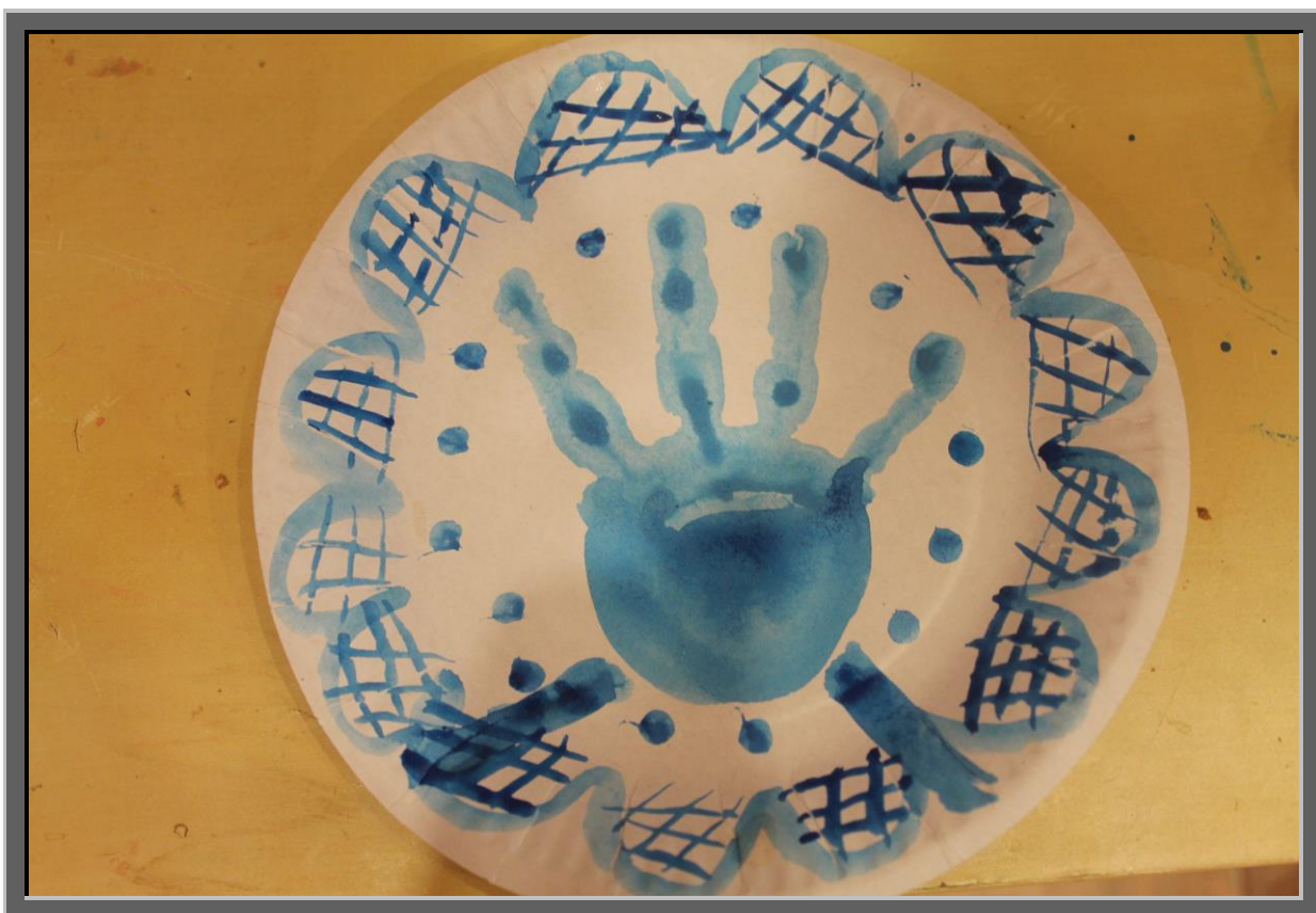
Рис.4 Получившиеся полукруги заштриховать пересекающимися линиями