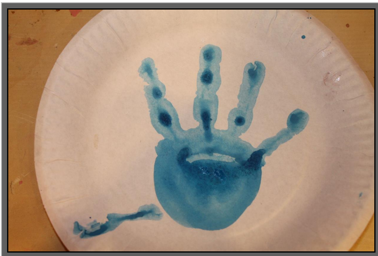
Рис.1 Нанести синюю краску на ладонь ребенка и отпечатать ее в центр тарелочки. Получился знаменитый «гжельский цветок»