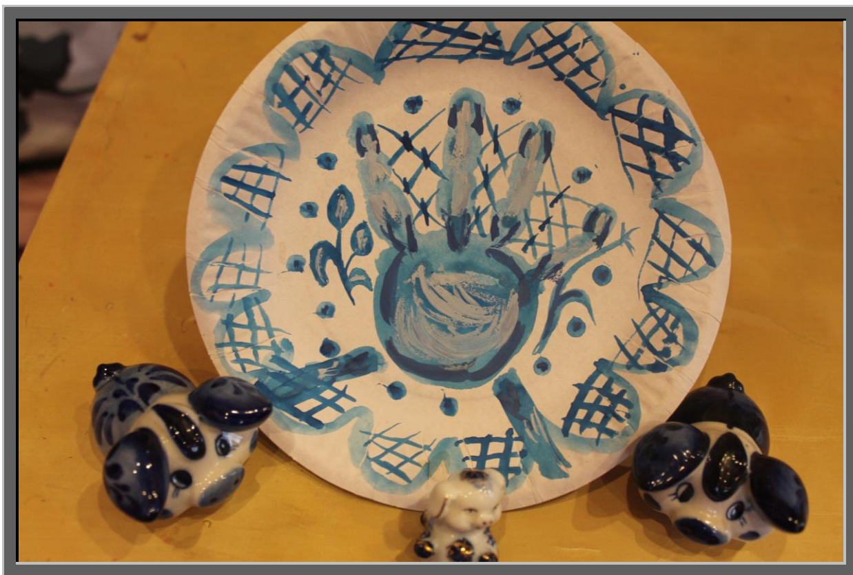
Рис.7 Легкими мазками тонкой кисти оттенить гжельский узор более темными и светлыми тонами (темно-синим и белым).

Такая расписная тарелочка не только найдет почетное место на полочке, но и станет прекрасным сувениром!