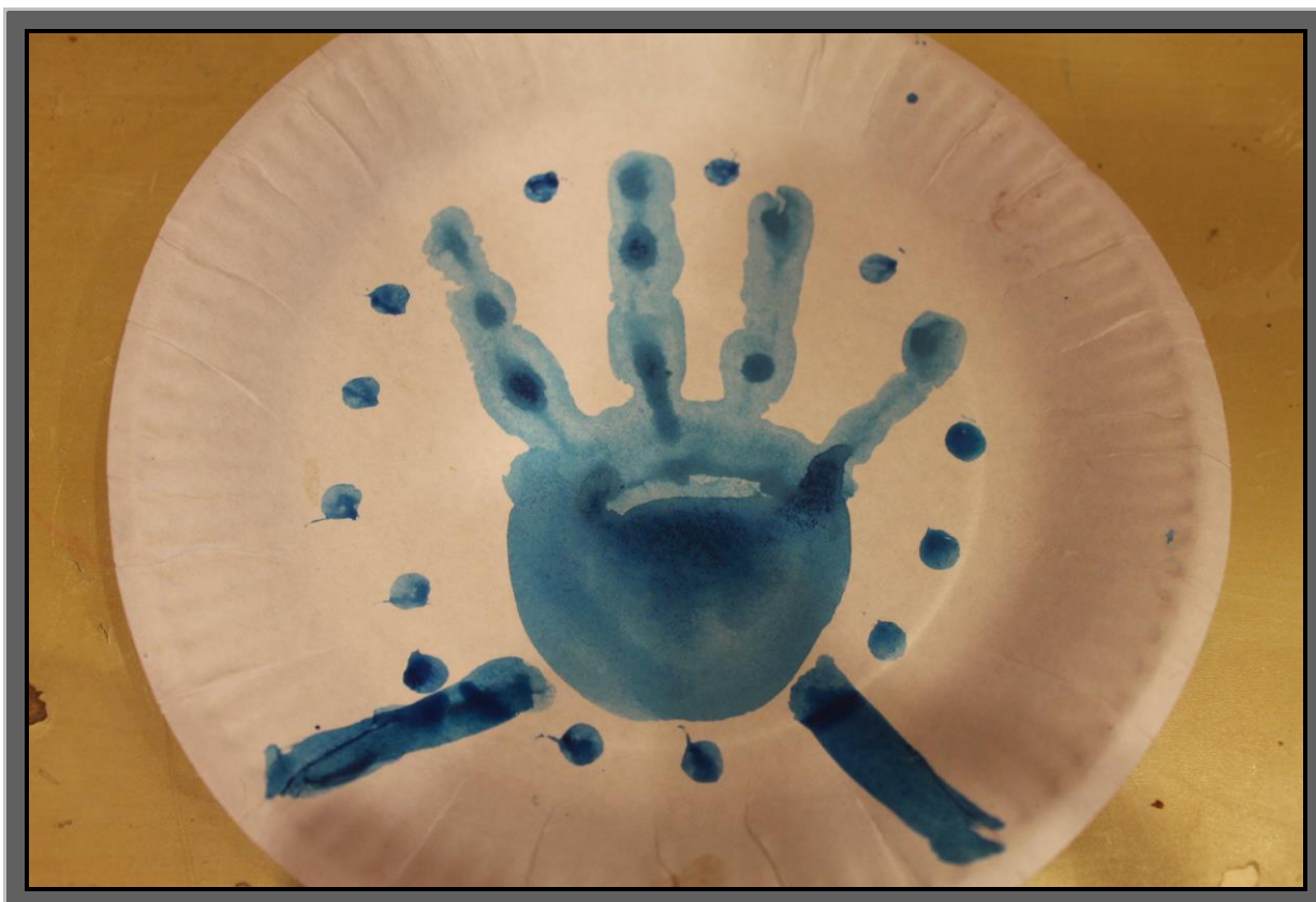
Рис.2 Немного подправить, придать симметричности и, с помощью ватной палочки и методом «тычок» поставить точки по кругу, синей краской