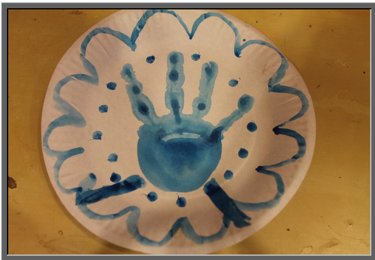
Рис. 3 По всему краю тарелочки, тонкой кистью с синей краской, провести волнистую линию