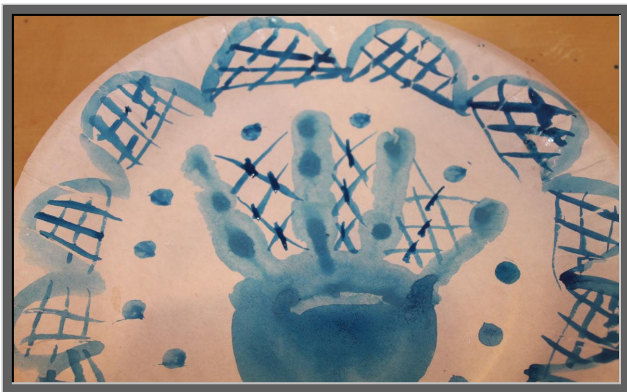
Рис.5 Лепестки гжельского цветка соединить пересекающимися линиями. В пересечениях линий провести небольшие вертикальные линии.